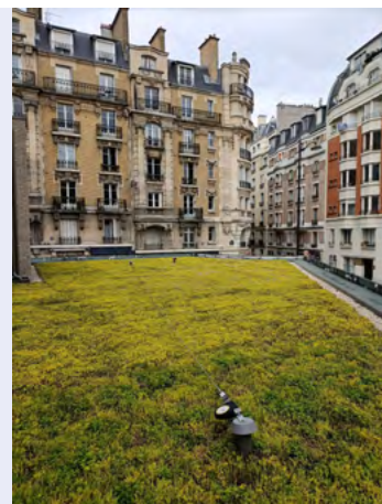
Projet du 17 rue Desnouettes